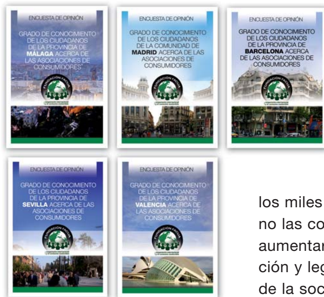
Portadas de las cinco encuestas realizadas en Sevilla, Madrid, Barcelona, Valencia y Málaga