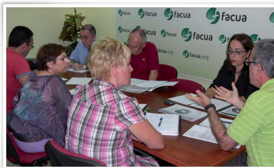
Reunión del Patronato de la Fundación FACUA

Durante 2010, el Patronato ha celebrado reuniones ordinarias en los días 29 de octubre y 2 de diciembre.