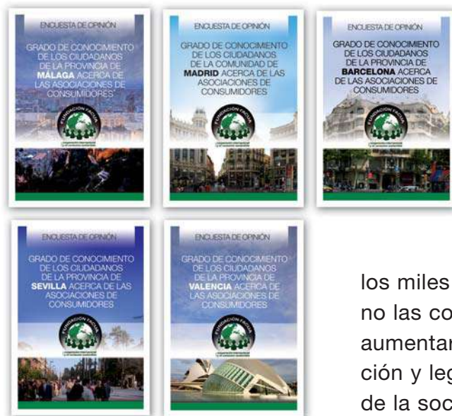
Portadas de las cinco encuestas realizadas en Sevilla, Madrid, Barcelona, Valencia y Málaga