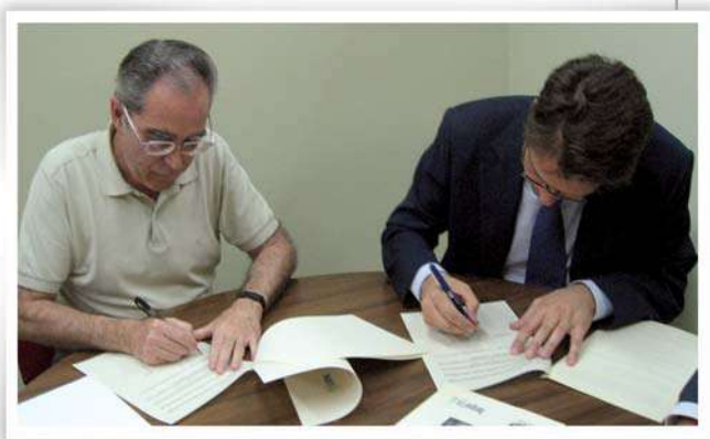
Firma del convenio de colaboración con la empresa Bogaris Retail

La finalidad de este acuerdo es articular la colaboración entre ambas entidades para implementar diversas actividades. Entre ellas se encuentra la realización de proyectos de cooperación para el desarrollo en países de América Latina y el Caribe que vayan dirigidos a beneficiar a los ciudadanos en su calidad de consumidores y usuarios o a mejorar el funcionamiento de las actividades comerciales. Otra de las actividades contempladas en el convenio es el desarrollo de programas que promuevan la formación y educación de los ciudadanos como consumidores y usuarios y, en especial, en relación al ámbito del comercio, en beneficio de éstos y de un mejor funcionamiento de las actividades comerciales.