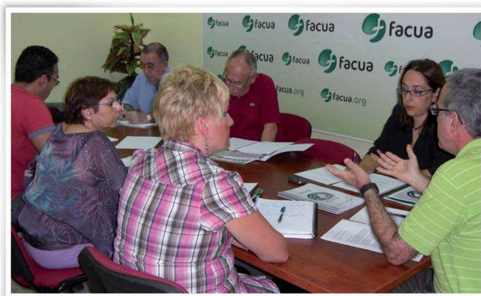
Reunión del Patronato de la Fundación FACUA

Durante 2010, el Patronato ha celebrado reuniones ordinarias en los días 29 de octubre y 2 de diciembre.