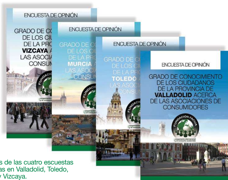
Portadas de las cuatro encuestas realizadas en Valladolid, Toledo, Murcia y Vizcaya.

Con este estudio también se pretende averiguar a través de qué vías o medios conocen los ciudadanos, a estas asociaciones y en qué medida está influyendo en esto el claro aumento de la presencia de las asociaciones de consumidores en los medios de comunicación, ya sea en la televisión, radio, internet, etc.