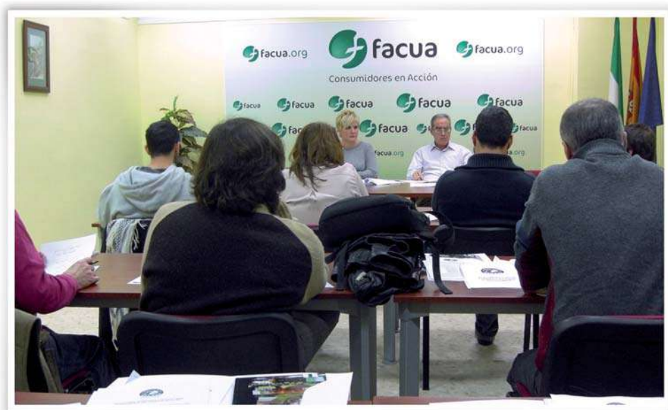
Reunión del Patronato de la Fundación FACUA.

Por acuerdo del Patronato, se procedió a la constitución de un Consejo Asesor formado por las siguientes personas: