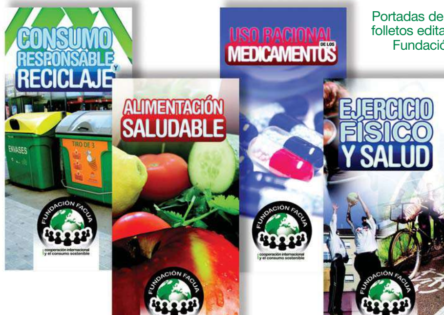
Portadas de los cuatro folletos editados por la Fundación FACUA.