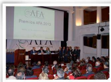
El evento se celebró en la sede de la Fundación Cajasol en Sevilla.

Con motivo del décimo aniversario de la AFA, más de tres-