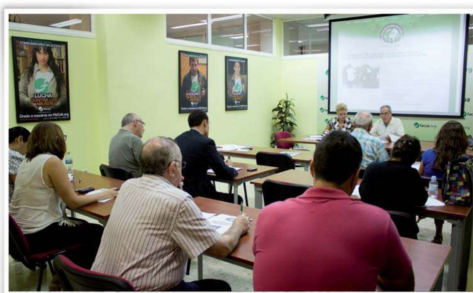
Una de las reuniones del Patronato de la Fundación FACUA en 2013.