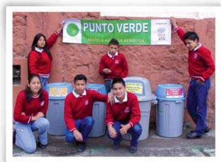
Instalación de punto verde realizada en un colegio de Quito (Ecuador).

envasadas en botellas plásticas y reciclaje de botellas plásticas ya utilizadas en dos escuelas de zonas urbano-marginales de Quito.