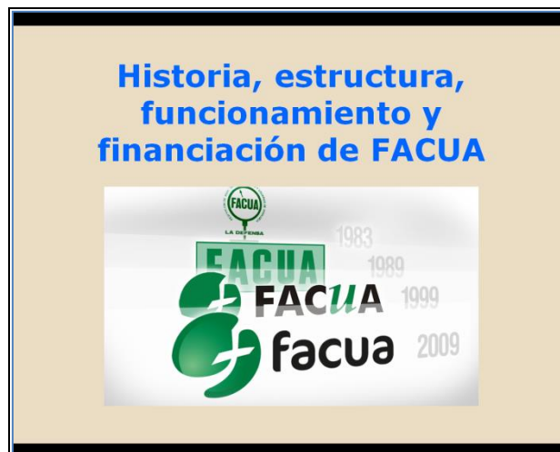
Cursos impartidos por la Escuela de Formación

Con estas actuaciones, la Fundación FACUA perseguirá también el