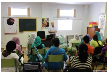
Curso impartido a inmigrantes

Estas actividades se realizan de manera presencial en los locales de FACUA, de Fundación FACUA o en el de otras entidades e instituciones, o por las organizaciones territoriales también en sus locales o en dependencias de las Administraciones públicas, universidades, centros escolares y de diversas entidades sociales, así como también de manera virtual a través de Meet o de otros soportes digitales.