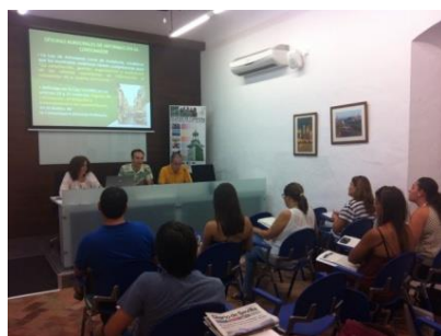
Curso impartido en la universidad