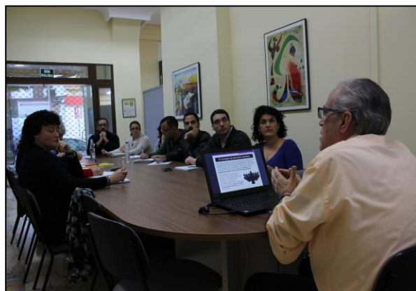
La formación de los cuadros directivos es fundamental el desarrollo de la organización de consumidores