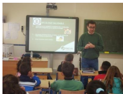
Curso impartido en un colegio

Cada ejercicio se elabora un programa formativo, partiendo de un análisis de necesidades previo, donde se trabajan los conocimientos, habilidades y actitudes que todas y cada una de las personas que forman parte de la organización FACUA, deben poseer para el correcto funcionamiento en su labor profesional, para el alcance de sus objetivos estratégico adaptado a los destinatarios y compuestos por las siguientes actividades formativas: