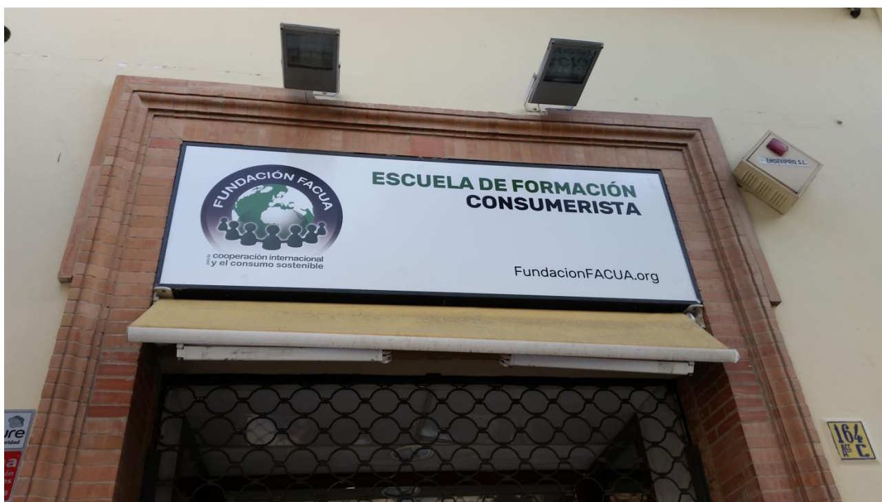
Sede la Fundación FACUA

La Fundación FACUA para la Cooperación Internacional y el Consumo Sostenible, ha asumido entre sus funciones fundamentales, tras el acuerdo adoptado con FACUA Consumidores en Acción, las competencias derivadas del funcionamiento de la Escuela de Formación Consumerista, ubicada en la calle Feria 164 de Sevilla.