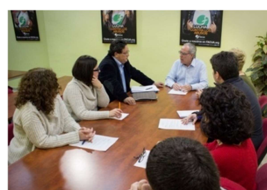
Fundación FCCR, ASPEC y ODECU