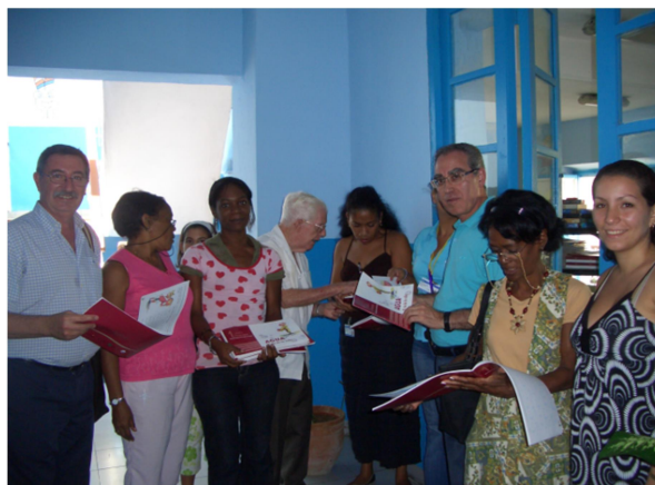
Los tres manuales que se impartieron en las 32 escuelas y momento de la entrega de los ejemplares en una de ellas

Junto con el apoyo a proyectos desarrollados por las organizaciones de defensa de los consumidores, representantes de FACUA y de la Fundación FACUA, han participado en eventos, seminarios, congresos, cursos de formación y reuniones de trabajo en un buen número de países del citado continente, a la vez que desde 2005 hasta 2016, han visitado la sede central de FACUA para conocer su funcionamiento