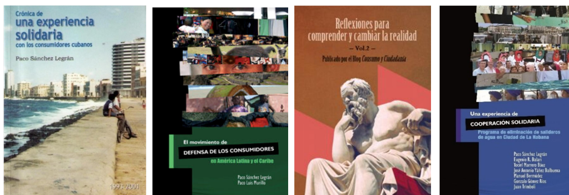
Portadas de cuatro de los diez libros editados

Una parte de estos libros fueron editados con ayudas de instituciones o empresas públicas españolas, como la Diputación Provincial de Sevilla y la Empresa Municipal de Aguas de Sevilla-EMASESA, así como por FACUA y la Fundación FACUA.