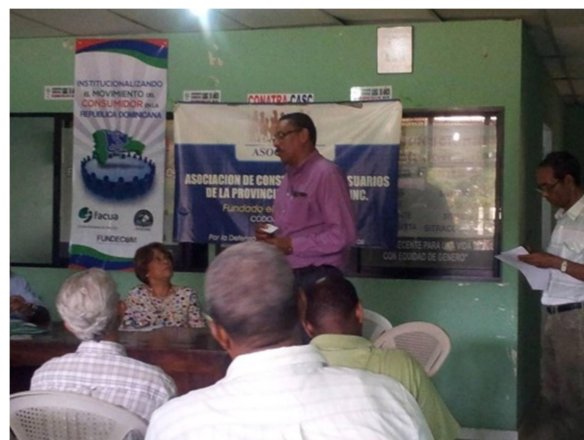
Proyectos realizados en El Salvador y en República Dominicana

Estos proyectos han abarcado temas como la defensa del derecho al agua, la educación sobre alimentación saludable o la defensa del medio ambiente, el