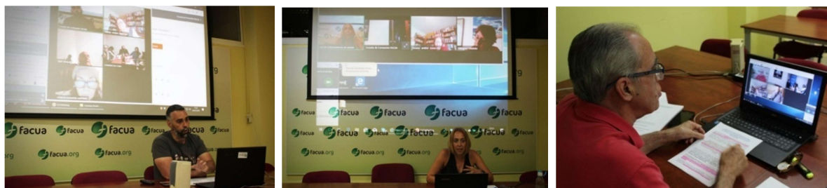
Imágenes de los talleres impartidos a 22 organizaciones de 14 países

La comunicación de FACUA a los ciudadanos y a la sociedad, como base para fomentar la creación de una red de consumidores en acción.