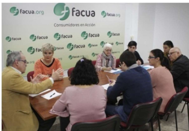
FOJUCC y Consumidores Argentinos, UNCUREPA-IPADECU y CONADECUS