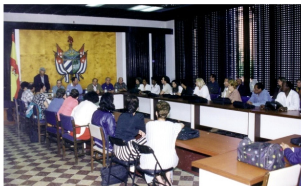
Firma del convenio con la Fundación y acto de clausura del curso de posgrado en la Universidad de La Habana

Gracias a esta colaboración, se pudo organizar conjuntamente entre FACUA y la Fundación Antonio Núñez Jiménez - FANJ, un curso de postgrado sobre protección del consumidor y medio ambiente, que se desarrolló en la Universidad de La Habana entre los años 1998 y 1999, con el patrocinio de la Dirección General de Consumo del Gobierno de la Junta de Andalucía y en el que participaron como ponentes o conferenciantes, además de representantes de la citada universidad y de las dos