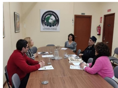
Consumidores de Ecuador y U.U.C de Argentina y FUNDECON

Complementando estas actuaciones en el ámbito de la cooperación internacional, FACUA y la Fundación FACUA, han colaborado activamente en proyectos de apoyo al Consejo Latinoamericano y Caribeño de Organizaciones de Consumidores - OCLAC que integra a la mayoría de las organizaciones de la región y de la Fundación Ciudadana por un Consumo Responsable de América Latina y el Caribe - FCCR, organización esta última con la que la Fundación FACUA está hermanada.