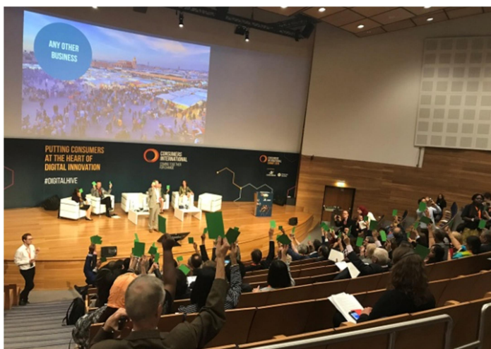
Portada del estudio sobre el suministro eléctrico y celebración de la asamblea de Consumers International en Portugal

También FACUA o su Fundación, han participado publicando artículos para publicaciones de organizaciones de consumidores de Turquía o impartiendo un curso de Formación en Marruecos o apoyando a organizaciones de consumidores como en el caso de la India o Taiwán, a la vez que dirigentes de FACUA y de su Fundación, viajaron en 2028 hasta Israel y Palestina en el marco de un proyecto coordinado por la ONG Asamblea de Cooperación por la Paz (ACPP) para conocer la situación de los usuarios de dicho Estado en cuanto al acceso a los suministros básicos y sus derechos como consumidores y comprobando cómo Israel limita el acceso a luz y agua a los usuarios de Palestina.