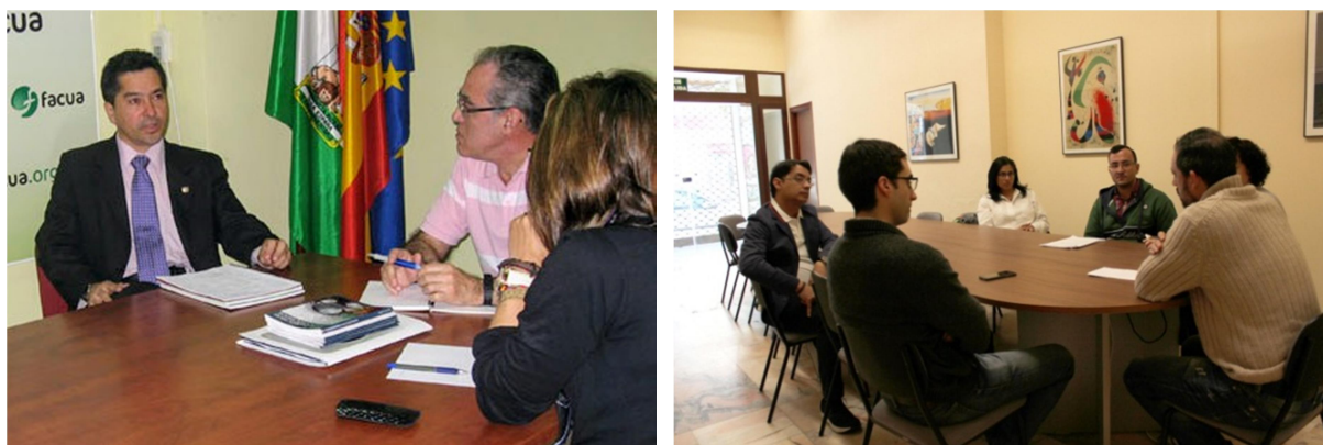
Visita de representantes gubernamentales de El Salvador y de Panamá

Paralelamente a esta actividad FACUA y su Fundación han mantenido relaciones de cooperación en relación a la protección de los consumidores con gobiernos de Costa Rica, Cuba, El Salvador, Bolivia, México y Panamá, que visitaron nuestros locales en Sevilla para conocer el funcionamiento de FACUA y sus actividades en defensa de los consumidores, recibir información sobre el marco normativo de protección a los consumidores en España o recibir formación sobre el Sistema Arbitral de Consumo en nuestro país, como fue el caso de la autoridad de Protección a los Consumidores de Panamá.